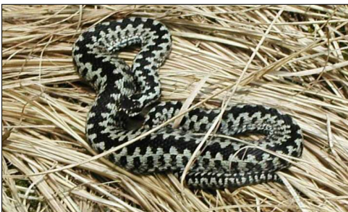
Hugormen er sky - bevæg dig stille, hvis du vil se den.

Der er et rigt fugle- og dyreliv omkring Stubbergård Sø. Er du heldig, kan du se fiskeørnen jage over søen, et firben, som soler sig eller de toppede lappedykkeres kurtiserende dans på vandet. Måske støder du også på spor efter oddere.